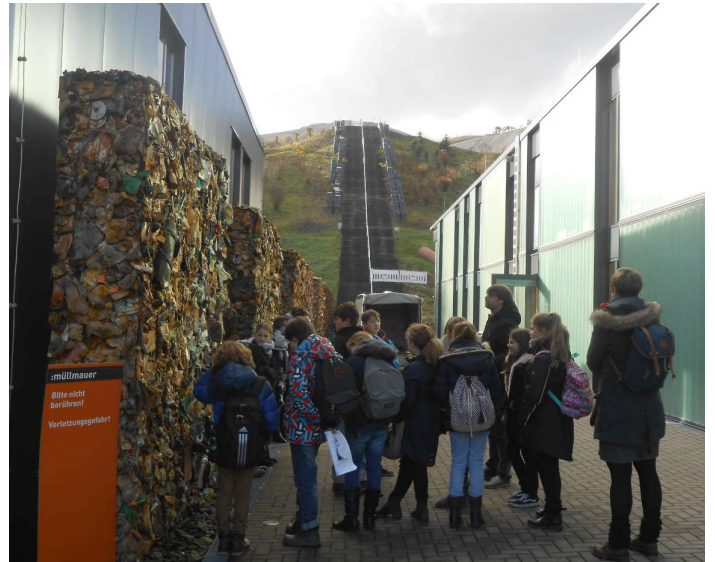
Blick auf den „Müllberg“ (Halde)