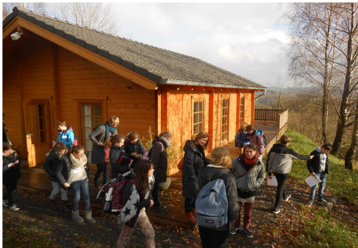
„Ein guter Tag hat 100 Punkte“