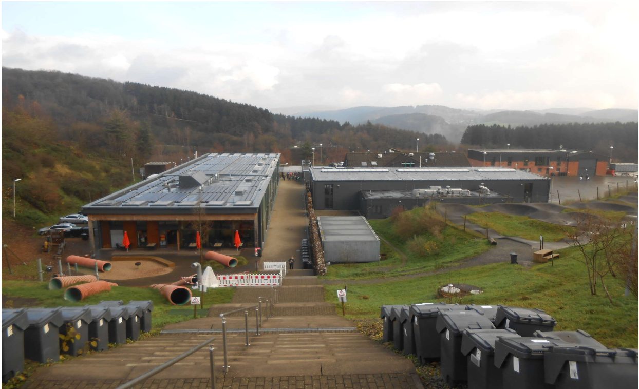
Blick auf das Metabolon Gebäude

Außerschulischer Lernort „Metabolon – Gärten der Technik“ in Lindlar