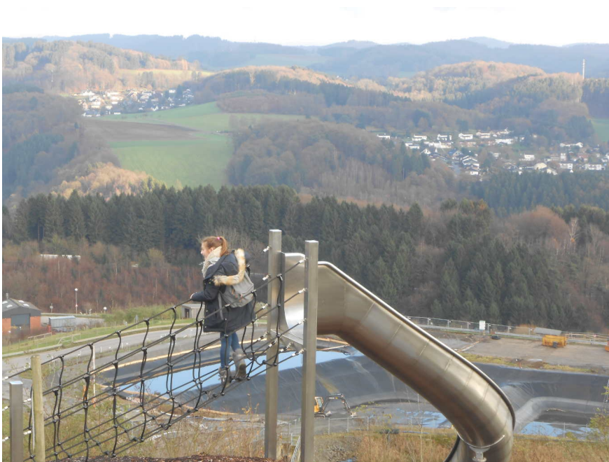
Rutsche auf dem Metaolon Gelände