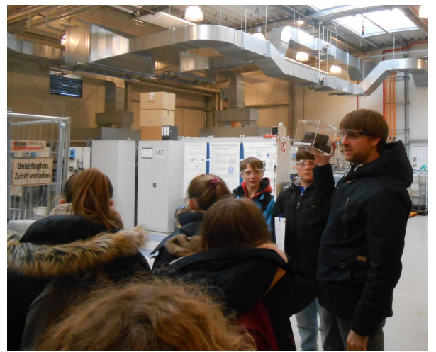
In der Forschungshalle: Carbonisierung und Mini-Biogasanalge