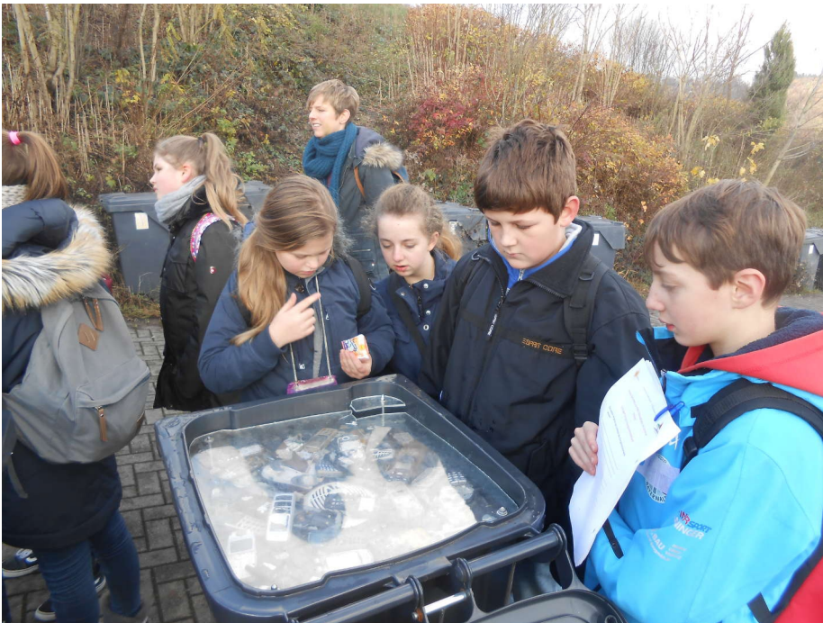
Die sprechende Mülltonne (zu Werstoffen in Handys)