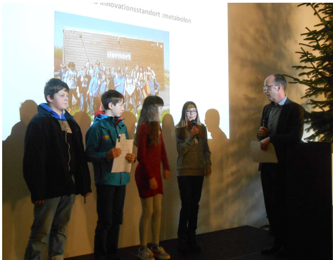
Urkundenverleihung durch Michael Theben, Abteilungsleiter im MWIDE NRW ( Ministerium für Wirtschaft, Innovation, Digitalisierung und Energie des Landes Nordrhein-Westfalen)