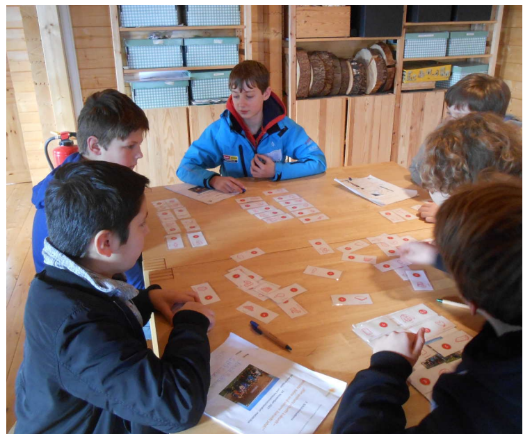
-Spiel zum CO 2 Verbrauch